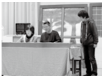
町民有志で結成した劇団が 「人権、家族」をテーマに熱演