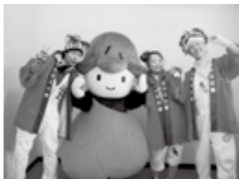
参加型の楽しいステージ 一緒に歌って踊りましょう