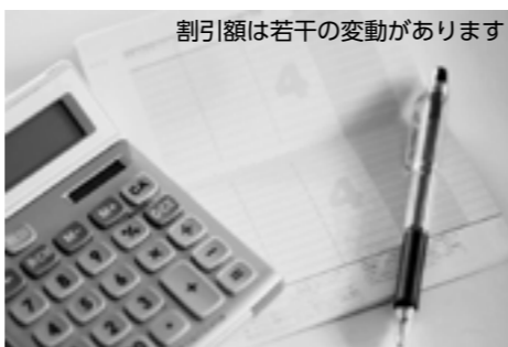
割引額は若干の変動があります

■法定検査 保守点検や清掃が適正に行われ、浄化槽が正常に機能しているかどうかを年に1回検査するものです。県浄化槽協会 ☎(284)3355から送られてくるのがきで申し込んでください。