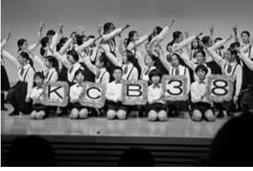
感謝の気持ちを歌にのせて