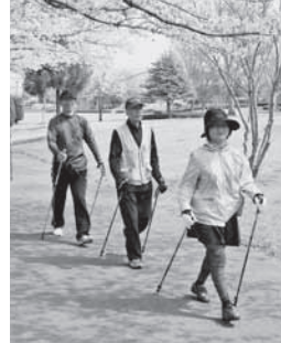
爽やかな汗をかこう