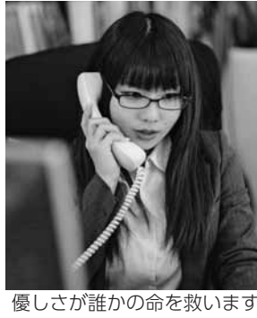
優しさが誰かの命を救います