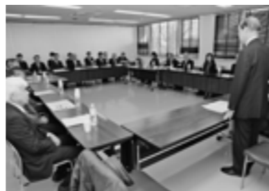
復旧・復興計画策定委員会の様子