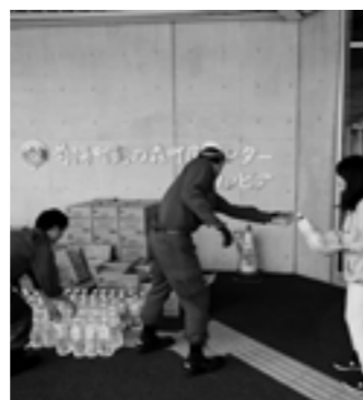
熊本地震の際、富士フィルム(株)から提供された水を配布する様子

富士フィルム(株)(東京都)と4月1日、緊急時における物資等の供給に関する協定を締結しました。この協定は、熊本地震の際、富士フィルム(株)から、菊陽町に立地する富士フィルム九州(株)を通じて、水をはじめとする多くの物資の供給を受けた経緯もあり、今回の締結となりました。協定により、緊急時に物資が速やかに供給され、発災初期から住民の