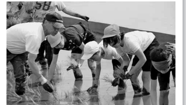
収穫を目指して丁寧に植え付けました

菊陽中部小学校の米作り体験学習が、6月29日に町内の水田で実施されました。参加したのは、5年生の児童約140人。地元の農家と熊本大学の学生ボランティアが、子どもたちに田植えの方法を指導しながら、全員で協力して約800平方mの水田に苗を植え付けました。参加した児童たちは、はだいで田んぼに入る感触に歓声を上げながら、米作りについて楽しく学びました。なお、秋には収穫体験も予定されています。