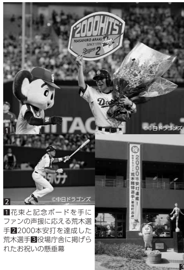
1花束と記念ボードを手にファンへの声援に応える荒木選手 22000本安打を達成した荒木選手 3役場庁舎に掲げられたお祝いの懸垂幕

1977年9月13日生まれ(39歳)、大堀木出身。右投げ右打ちの二塁手。菊陽中部小学校、菊陽中学校から熊本工業高校に進学し、甲子園に2回出場(94年春、95年春)。1995年に中日ドラゴンズからドラフト1位指名を受けて入団し、現在に至る。2007年には盗塁王のタイトルを獲得したほか、これまでにベストナイン3回、ゴールデングラブ賞を6回受賞し、2008年には北京オリンピックにも出場。