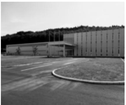
完成した(株)アイディエス「熊本菊陽工場」

(株)アイディエス熊本菊陽工場が完成し、6月13日に竣工記念式典が行われました。同社は町と昨年3月15日に工場立地協定を締結。新工場の延床面積は約6,300平方メートル。医療用「検体搬送システム」の専門企業で世界トップクラスの技術力を持ち、海外にも製品を出荷しています。新工場の完成により、地域経済のさらなる発展が期待されます。