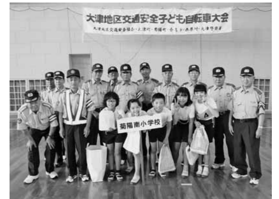
大会で健闘した菊陽南小学校チーム

大津地区交通安全子ども自転車大会が6月17日、本田技研工業(株)熊本製作所体育館で開催されました。大会には、大津警察署管内の小学校5校から7チーム計28人が参加し、本町からは菊陽南小学校が出場。幅30mの通路やスラローム走行などが待ち受ける難関コースがある実技や学科試験で競いました。惜しくも入賞とはなりませんでした。大会を通して交通ルールを守る大切さを学びました。