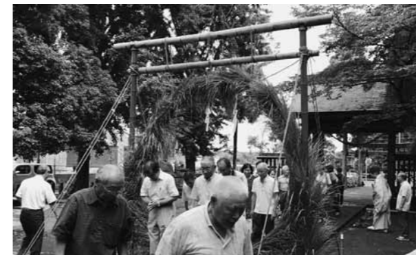
茅の輪をくぐる参加者たち

半年間のけがれをはらい、心身を清めるための神事「大はらい式」が6月30日、大原阿蘇神社(新町)で行われました。神事には、新町、南方、中尾、古閑原、入道水、柳水、駅前、馬場地区の8地区の住民ら約40人が参加。式の後、参加者はカヤで作られた直径2.5mの輪をくぐって、年末までの無病息災を祈りました。参加者の一人は「これから暑くなるので、体調には特に気を付けて過ごしたい」と話しました。