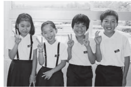
伝えあえるなかま(作者は左から2人目)

わたしは、この三学期の人権月間に、一年間のふり返りとして自分のことを見つめてみました。すると、今の自分のことが見えてきました。