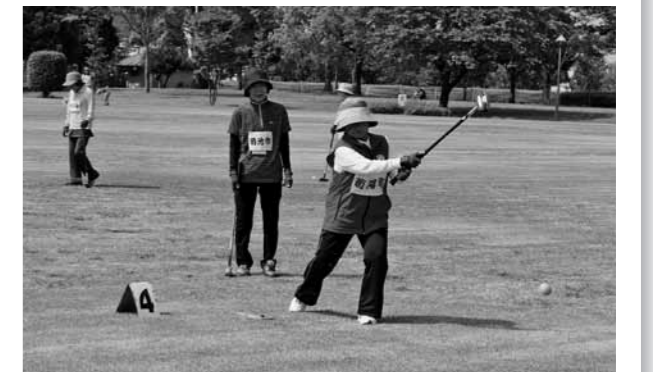
熱戦を繰り広げたグラウンドゴルフ(女子)

第68回菊池郡市民体育祭が、5月13日から6月18日まで菊池郡市内の各会場で開催されました。本町は、グラウンドゴルフ(女子)、ゲートボール(男子)、軟式野球、ソフトテニスで見事優勝しました。菊池郡市代表の選手たちは、9月に人吉球磨地区で開催される第72回熊本県民体育祭に出場します。【優勝】グラウンドゴルフ(女子)、ゲートボール(男子)、軟式野球、ソフトテニス【準優勝】卓球、サッカー、バドミントン(男子)、ソフトボール(女子)