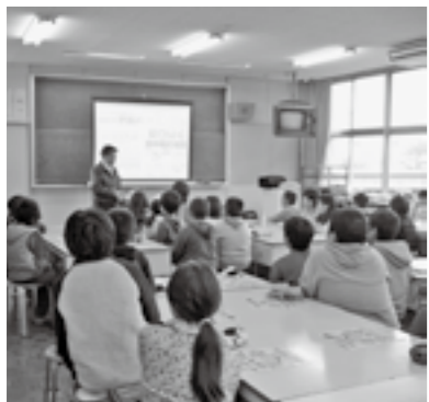
菊陽北小学校で行われた手洗い講習会の様子

菊陽町食品衛生協会は、食品衛生に関する講習会の開催や、食中毒予防のための広報活動、食品衛生施設の一斉巡回指導、食品衛生に関する最新情報の提供を行っています。また、万が一の食品事故に備えるための食品共済保険を取り扱っています。同協会では会員を随時募集しています。詳細はお問い合わせください。