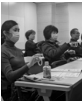
養成講座の様子(昨年度)