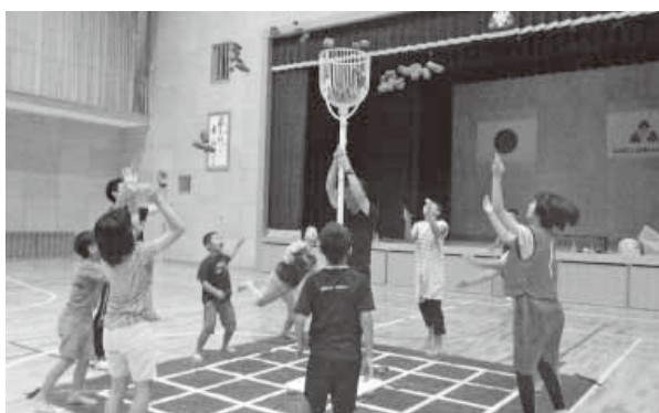
ニュースポーツ・アジャタで交流を深めました

本町の子どもたちは「交流会を通して新しい友達ができ」「来年は屋久島町を訪問して、またみんなと遊びたい」と笑顔で話しました。