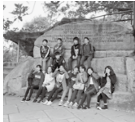
ミセス・マッコリーズ・チェアにて