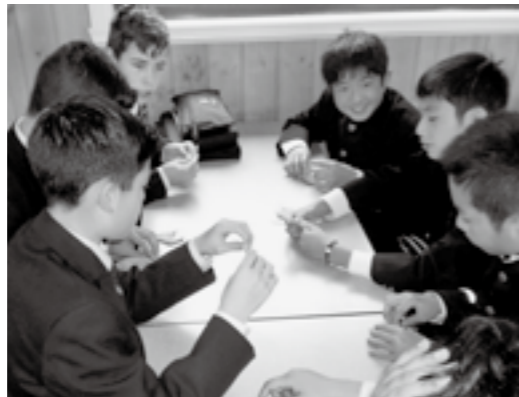
日本の文化である折り紙を現地の生徒に教えました