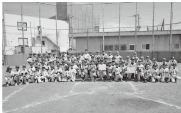
出場者全員で仲良く写真撮影