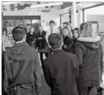
英語や日本語を使って交流をする生徒たち