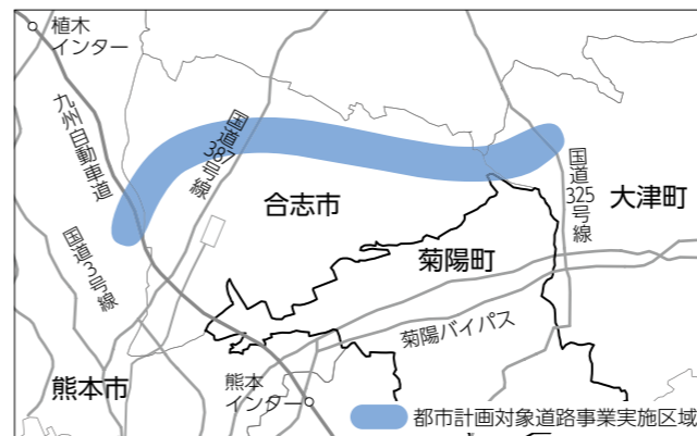
環境影響評価方法書の調査区域(地図全域)