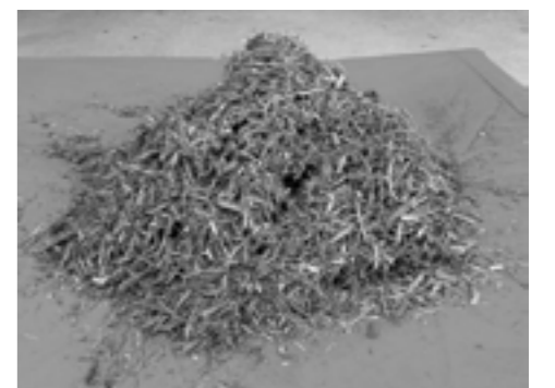
チップ状に粉砕された樹木