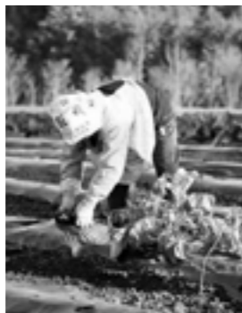
農業について基礎から学んで みませんか。

▼日時 12月18日(月)、19日(火) 午前10時～午後4時 ▼場所 南部町民センター ▼対象者 町内在住者 ▼定員 10人程度 ▼申し込み方法 電話で申し込む ▼申し込み・問い合わせ 菊陽町シルバー人材センター ☎(232)6276