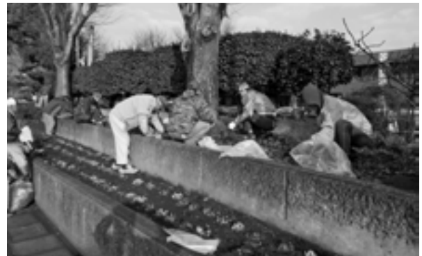
地域を美しく保ちましょう

参加した会員は「寒い中での作業でしたが、とてもきれいになりました。地域の皆さんの役に立ててうれしいです」と笑顔で話しました。