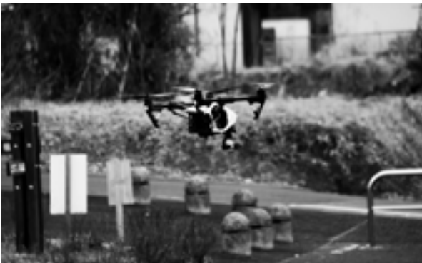
上空から被害を把握するためのドローン

今年度は菊陽北小学校区を対象に、地震発生直後を想定した住民参加型の訓練を実施。災害時に重要な「自助」「共助」をテーマに避難所の運用や救護、炊き出しなどの訓練を行いました。会場では防災用品の展示や、県警が所有するドローンを用いた訓練も行われ、防災意識の向上を図りました。