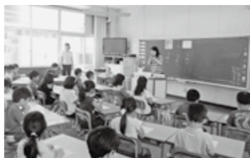
1年生のフッ化物洗口の様子