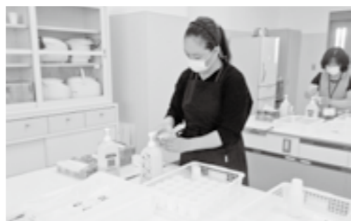
フッ化物の水溶液を準備する保護者