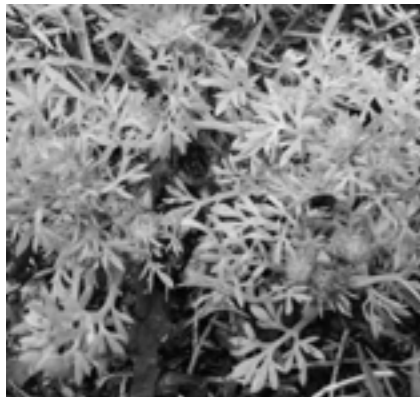
公園に生えている様子

また、芝生や草むらでは、直接座らない、手を突かない、はだして歩かない、などの注意が必要です。