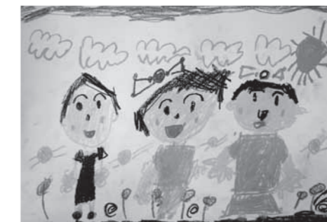
絵の題名「うちのはたけ」

ぱぱとままとわたしで、うちのはたけにぶろっこりをうえたよ。みずをあげるときにぱぱがわたしに、みずをかけてきた。つめたかった。