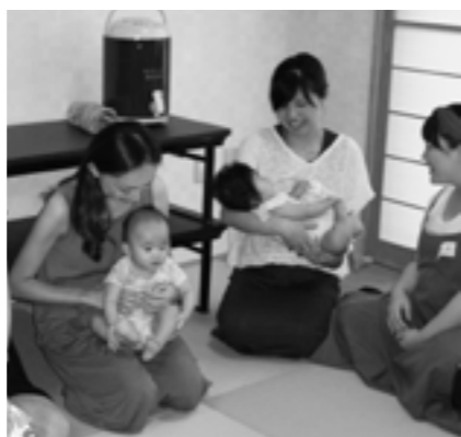
赤ちゃんとふれあう妊娠中のママたち