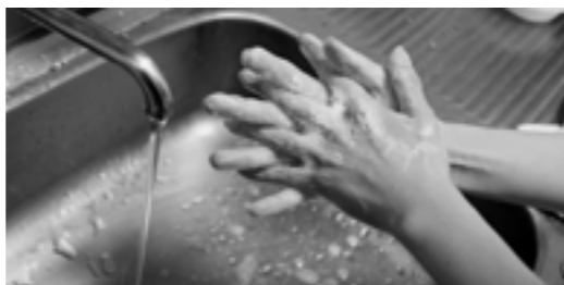
しっかり手洗いしてくださいね♪