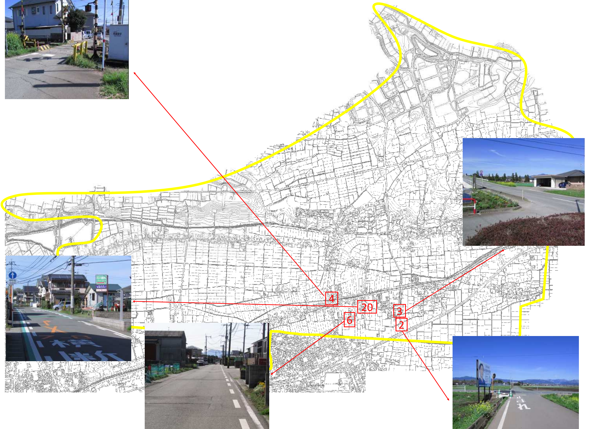
菊陽中学校（北小校区）