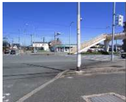
菊陽中学校（中部小校区）